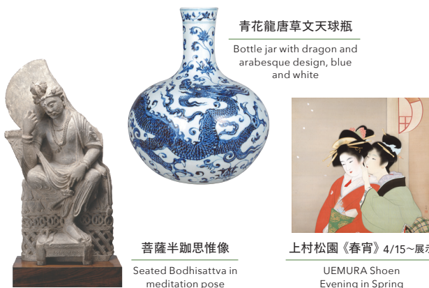
青花龍唐草文天球瓶

今 から50年前、1975年11月25日 新橋に松岡美術館が開館しました。美術館開設にあたり、創設者 松岡清次郎(1894-1989)は「国内にない美術品をご覧いただきたい」という想いのもと、生涯を通じてグローバルな視点にたった蒐集を続け、現在の松岡コレクションが形成されました。今展では、1975年の開館記念展が白金台で甦ります。新橋時代の展示ケースや手書きキャプションも使用して当時の雰囲気再現するとともに、既に多彩なジャンルの作品が並んだ開館当時の松岡コレクションオールスターをご覧ください。