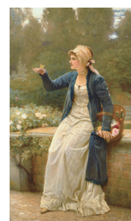
チャールズ・E・ベルジーニ《東の間の喜び》

Two handled jar with Myth of Orpheus design, Majolica ware